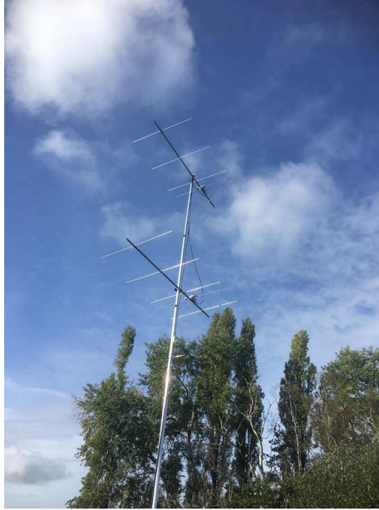
Mooie setup van ON7TG/P met 2 x 5 el. Stacked 2m Yagis